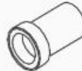
7 BONCPPBP-021 Eje del cigüeñal Crank shaft