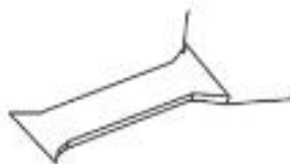
9 BONCPPBP-027 Cubierta del émbolo Plunger Cover