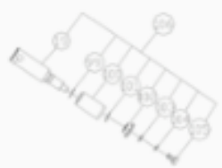
33 BONCPPBP-106 émbolo de cerámica ceramic plunger