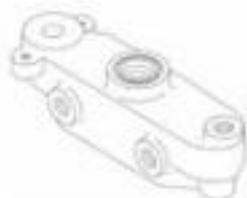
17 BONCPPBP-045 Sello de aceite de drenaje Drain oil seal