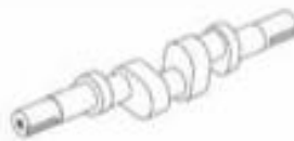
6 BONCPPBP-020 émbolo plunger