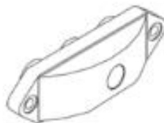
14 BONCPPBP-041 Conjunto de la válvula Valve Assy