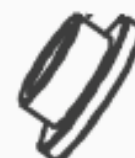
32 BONCPPBP-102 conjunto de descarga discharge assy