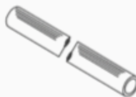
27 BONCPPBP-096 Copa de latón Brass Cup