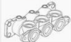
12 BONCPPBP-036 CILINDRO CYLINDER