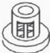
13 BONCPPBP-040 Conjunto de manguera de succión Suction hose assy