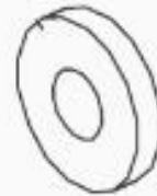
4 BONCPPBP-014 Sello de aceite, cigüeñal Oil Seal, Crank Shaft