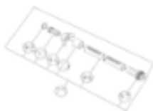
21 BONCPPBP-075 Tornillo de ajuste Adjusting Screw