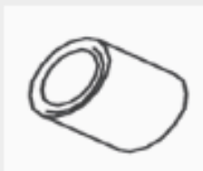
25 BONCPPBP-090 Copa de latón Brass Cup