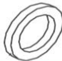
11 BONCPPBP-034 V. EMBALAJE V. PACKING