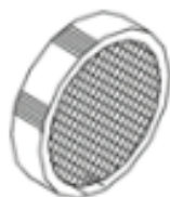
29 BONCPPBP-098 colador de núcleo core strainer