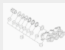
24 BONCPPBP-078 conjunto de asiento de desbordamiento overflow seat assy