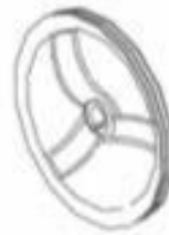
3 BONCPPBP-012 Polea Pulley