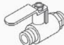
15 BONCPPBP-043 Conector de succión Suction connector