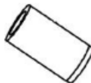
31 BONCPPBP-100 colador strainer