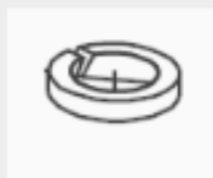
22 BONCPPBP-076 Conjunto de tornillo de ajuste Adjusting screw assy