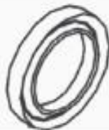
10 BONCPPBP-033 V. EMBALAJE V. PACKING